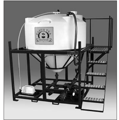
Fermenteur à thé de compost oxygéné utilisé par l'ITA St-Hyacinthe.

Le thé de compost est utilisé soit en foliaire, soit directement au sol soit encore en ferti-irrigation. En général, le thé de compost est utilisé à une