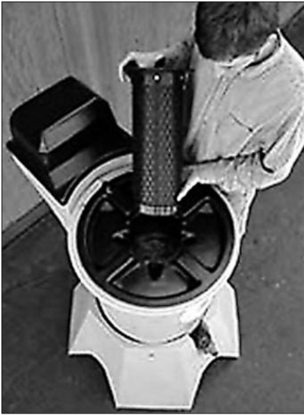
Filet pour le compost de la compagnie Bob's Compost Tea Brewer.

sont faibles. Les organismes bénéfiques présents dans le thé de compost produisent continuellement des acides aminés et des enzymes, qui aident à la libération de nutriments autrement non disponibles comme les macroéléments : azote, phosphore, potassium, calcium et aussi les oligoéléments : magnésium, sodium, fer, bore, molybdène, cuivre manganèse, cobalt, sélénium et zinc.