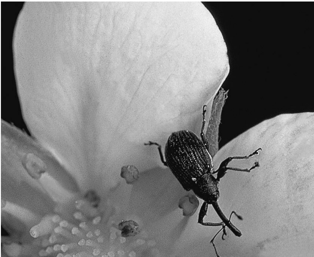
L'anthonome du pommier et les dégâts qu'il cause: les fleurs attaquées restent fermées puis se dessèchent.